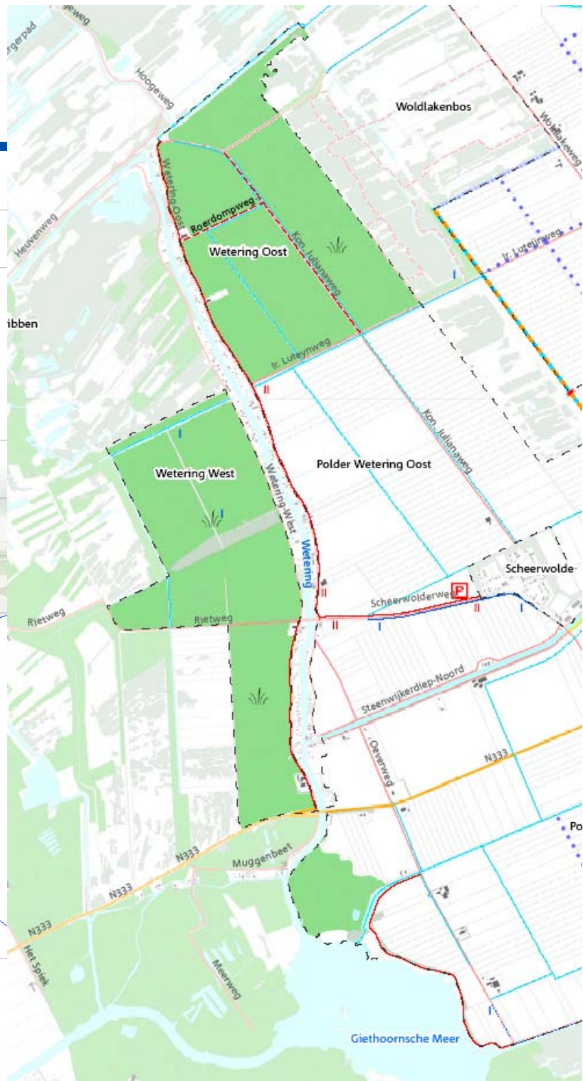
Gedeelte van kaart 'Inrichtingsplan Scheerwolde' Versie 22-01-2010

dienst landelijk gebied voor ontwikkeling en beheer