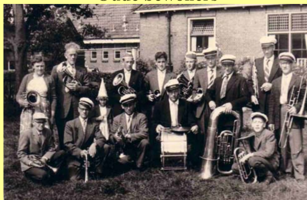
Muziekvereniging De Bazuin uit een ver verleden

Eénmaal per jaar vaart de ‘Muziekvereniging de Bazuin Wetering e.o.’ in de vroege avond muziekmakend door de Wetering naar Muggenbeet en terug. Dit jaar gebeurt dit op 1 juli of 8 juli 2009 (afhankelijk van het weer). Noteer dit in uw agenda!