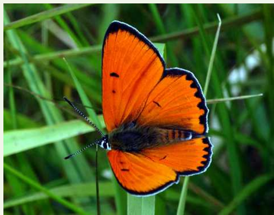
Grote vuurvlieder

Er leven naar schatting zo'n 200 à 300 vlinders in de hele wereld.