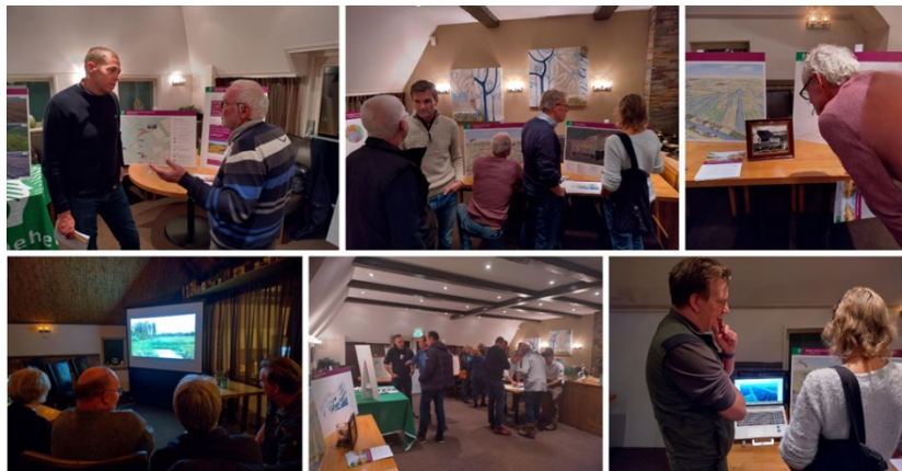
Sfeerimpressie inloopbijeenkomst november 2023

Deze nieuwe fase gaat het landschappelijke aanzicht van de gebieden aanzienlijk veranderen. Dit hebben we met foto's, vogelvluchttekeningen en dronebeelden van uitgevoerde werkzaamheden inzichtelijk gemaakt. Aan de diverse tafels kregen de bezoekers uitleg over de plannen, de geplande werkzaamheden en de planning. Samen met alle waardevolle gesprekken geeft het de bewoners een goed beeld wat dat betekent voor hun achtertuin.