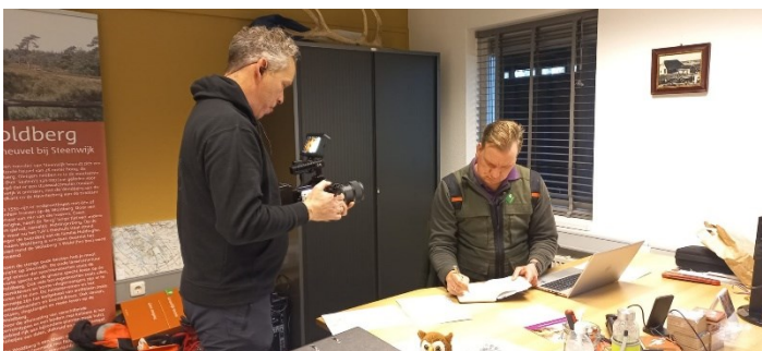
Filmopname uitleg werkzaamheden in deelgebied Kooi van Pen