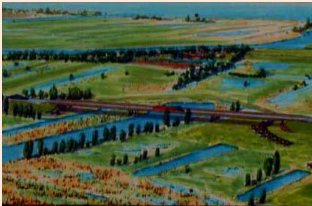
Impressie van de nieuwe brug bij Muggenbeet