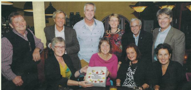
Taart van de week voor Jubileumcommissie

Nog een paar dagen en 2013 behoort tot het verleden. Het jaar waarin Plaatselijk Nut Wetering e.o. op uitbundige wijze het 100 jarig bestaan heeft gevierd. Dankzij de bijzondere inzet van een aantal leden kunnen we terugkijken op een prachtige feestdag en is er als blijvende herinnering een bijzonder fraai boek verschenen. Jong en oud, bewoners en oud-bewoners, iedereen was laaiend enthousiast.