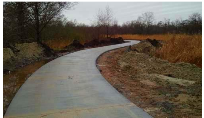
Nieuwe fietspad bij de Vloddervaart

Door dit nieuwe fietspad is de mogelijkheid behoorlijk vergroot, om van de mooie natuur in onze omgeving te kunnen genieten.